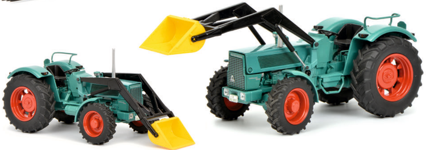
Hanomag Robust 900 mit Frontlader/with front loader 45 077 9900

Der Hanomag-Radschlepper Robust 900 war der größte und stärkste in Serie produzierte Hanomag-Schlepper aller Zeiten und wurde von 1967 bis 1970 produziert. Im Wesentlichen unterschied er sich vom Brilliant 701 durch seinen größeren und stärkeren Motor, der es auf eine Leistung von 85 PS brachte. Schuco präsentiert diesen typischen Schlepper der 60er-Jahre als hochwertige Metall-Miniatur mit funktionierendem Frontlader im Sammler-Maßstab 1:32. Die Schuco Edition 1:32 überzeugt durch ihre sehr detaillierte und präzise Umsetzung. Der Traktor verfügt über eine funktionierende Lenkung und darf in keiner Traktorensammlung fehlen.