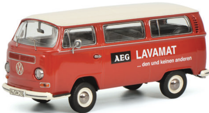
VW T2a Bus L Luxus „AEG Lavamat“, rot/red