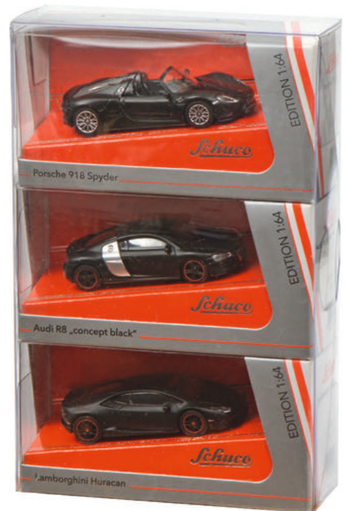
3er Set „concept black“ Porsche 918 Spyder, Audi R8 Coupé, Lamborghini Huracán