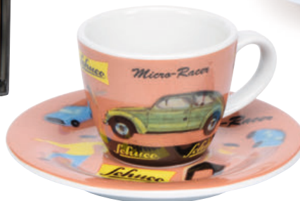
Schuco Espressotasse/espresso cup „Micro Racer“