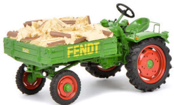
Fendt Geräteträger GT mit Ladegut „Scheitholz“/with fire wood load