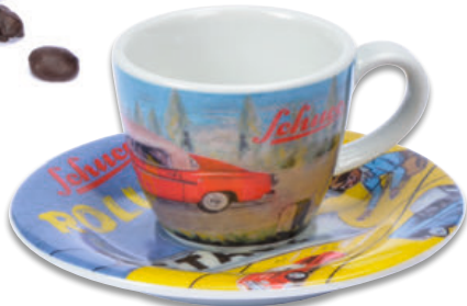
Schuco Espresso Tasse/espresso cup „Schuco Rollfix“