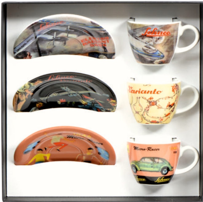
Schuco Espressotassen/espresso cups Set 2