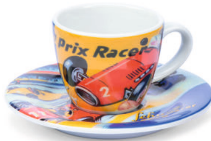
Schuco Espressotasse/espresso cup „Grand Prix Racer“