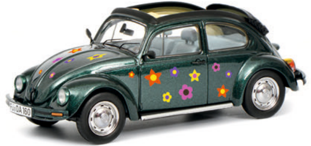
VW Käfer Open Air „Blumen-Dekor“, grün/green*