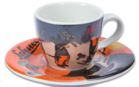
Schuco Espresso Tasse/espresso cup „Schuco Tanzfiguren“