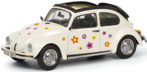
VW Käfer Open Air „Blumen-Dekor“, weiß/white*