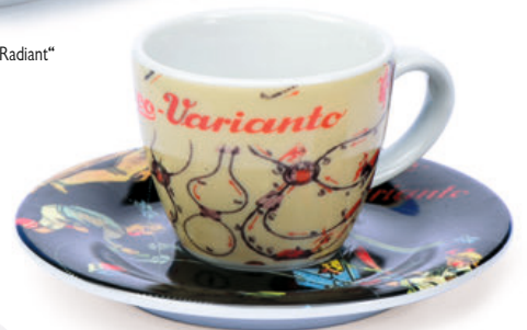
Schuco Espressotasse/espresso cup „Varianto“