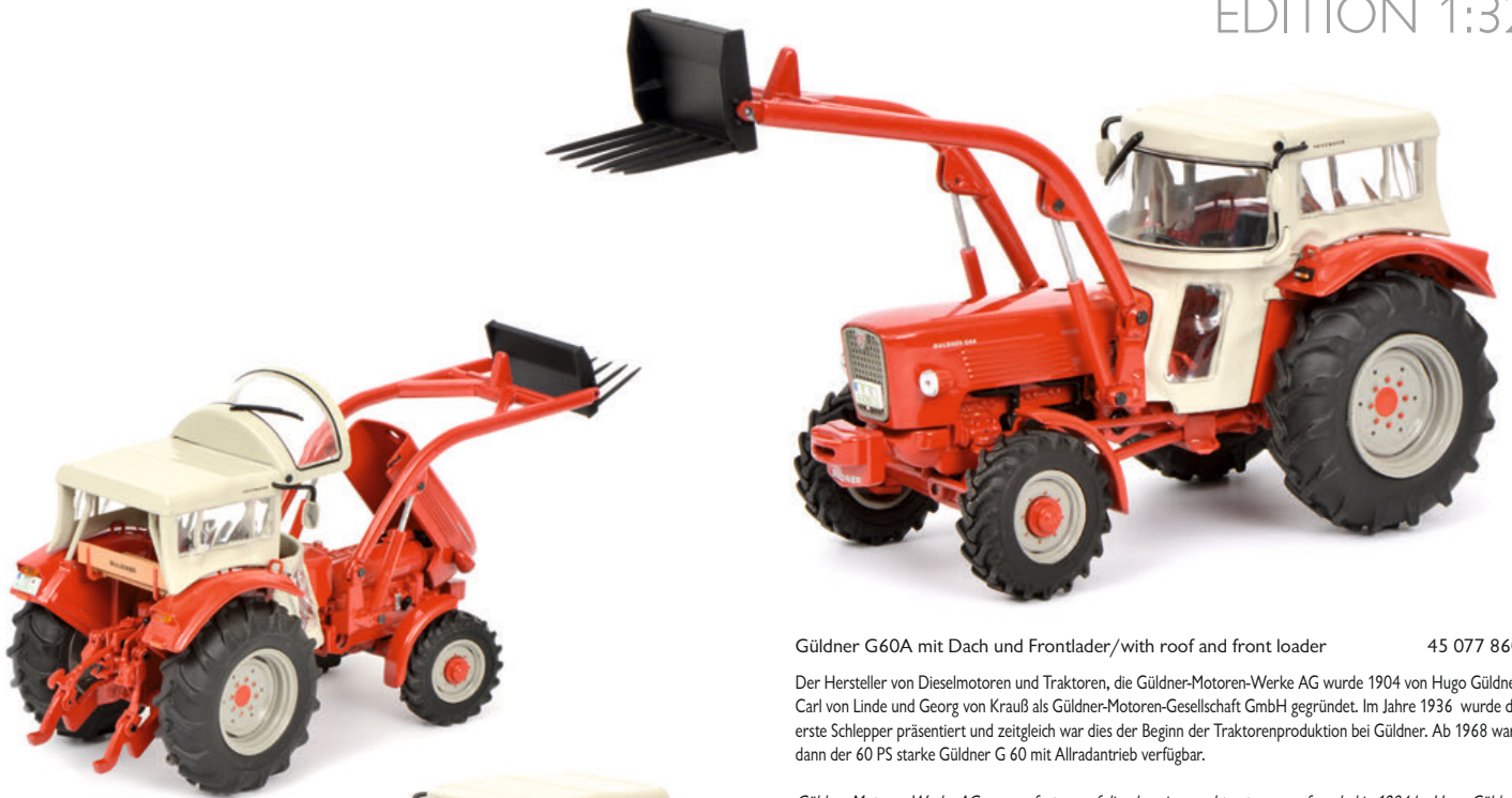
Güldner G60A mit Dach und Frontlader/with roof and front loader 45 077 8600