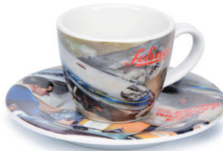
Schuco Espressotasse/espresso cup „Radiant“